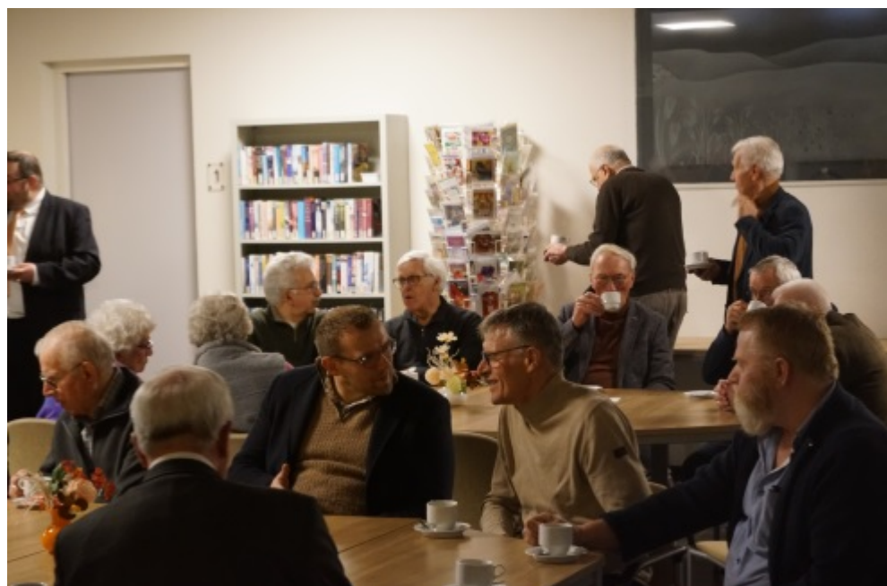
Tijdens de korte pauze werd er wat met elkaar gesproken