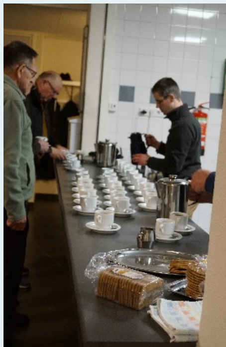
Het ontbrak de aanwezigen aan niets.