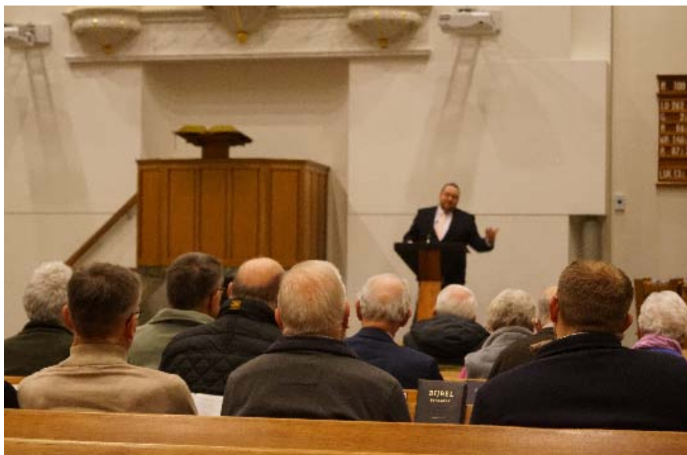
Er waren rond de 30 aanwezigen deze avond